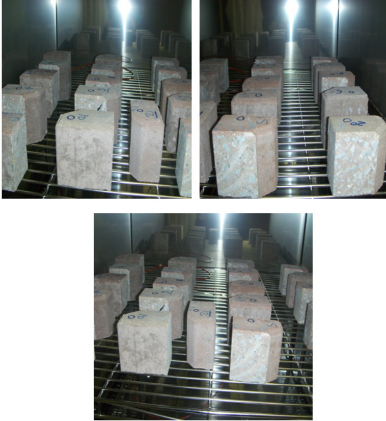
Şekil 2. Renkli beton ürünlerinin iklimlendirme kabineye yerleştirilmesi

Kırmızı çamur ikameli beton ürünlerin renklerinin, güneş ışığı ve/veya iklim koşullarından etkilenme derecesi TS 5358 EN 12608 standardına göre gerçekleştirilen ömür performans testleri ile belirlenmiştir [8]. Ömür performans testleri için; Devlet Meteoroloji İşleri Genel Müdürlüğü'nün, Marmara Bölgesi için verdiği istatistiklerden, 1975-2011 yılları arasındaki kış koşullarında, hava sıcaklık verileri ortalaması -10^{\circ}\text{C} , yaz koşulları için hava sıcaklık verileri ortalaması ise +40^{\circ}\text{C} hesaplanmıştır [9]. Yaz ve kış sıcaklıkları dikkate alınarak, 1 yıllık süreye karşılık gelen 37 çevrim için bir program oluşturulmuş, geliştirilen ürünler Atlas marka SC 600 MGH model solar klimatik test kabininde bekletilmiştir (Şekil 2).