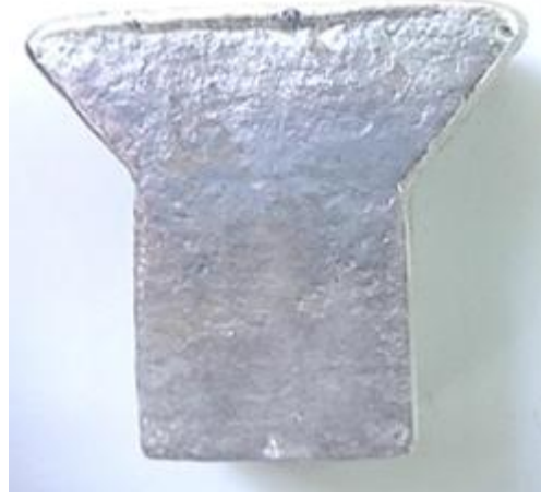
Şekil 2. Replicast CS yöntemi ile dökülen parçanın görüntüsü

Sertlikler arasında kılarkin ilk nedeniyapısalıdır. Ayrıca artan katılşma hızı ile birlikte katı eriyik sertleşmesinin sertlik artışına katkısının da artacağı bilinmektedir.