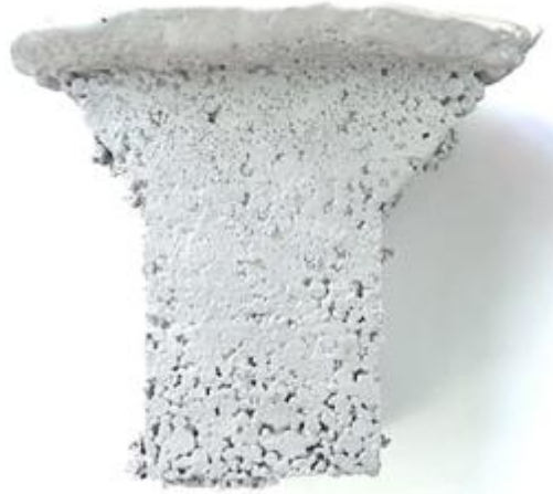
Şekil 1. Dolu Kalıba Döküm Yöntemi Kullanılarak Dökülen Parça

Şekil 2' de ise Replicast CS yöntemi ile dökülen parçanın görüntüsü verilmektedir. Bu parçanın üzerinde yapılan incelemede metalin kaplamayı delmesi, karbon hatası ve yüzey kalitesini olumsuz etkileyebilecek her hangi bir unsura rastlanmamıştır.