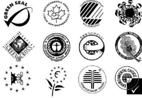
Şekil 3. Çevresel ürün etiketleri [17]

fırtınadan sonra Avrupa’da çevreye uyumlu ilk yağlayıcının (Environmentally Adapted Lubricants EAL’s) kullanımına başlanılmıştır. Temizlik malzemesi ve ürünleri, boya, ev araç gereçleri, sabun gibi zehirli atıklar içermeyen, bozunabilen çevre dostu ürünleri belirten Şekil 3.’de de görülen bazı çevresel etiketler Japonya, Kore, Çin, Tayland, Çek Cumhuriyeti, Amerika ve Kanada’da kullanılmaya başlanılmıştır.