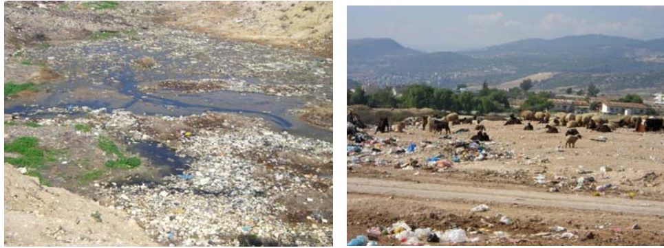
Şekil 2. Rehabilitasyon Öncesi Sahadan Görüntüleri

Sızıntı suları sahanın belirli noktalarında küçük göller halinde toplanmış olup, bir kısmı sahanın konuştığı dere yatağı boyunca drene olmaktadır. Sahada giriş ve çıkışlar kontrollü olmadığı için çöp toplayıcıları ve koyun sürüleri çöp yığınlarının üzerinde sağlıksız bir biçimde dolaşmaktadırlar.