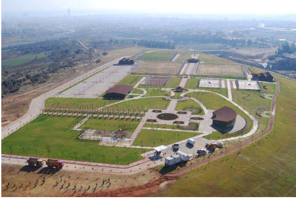
Şekil 4. Rehabilitasyon Sonrası Sahanın Görünümü