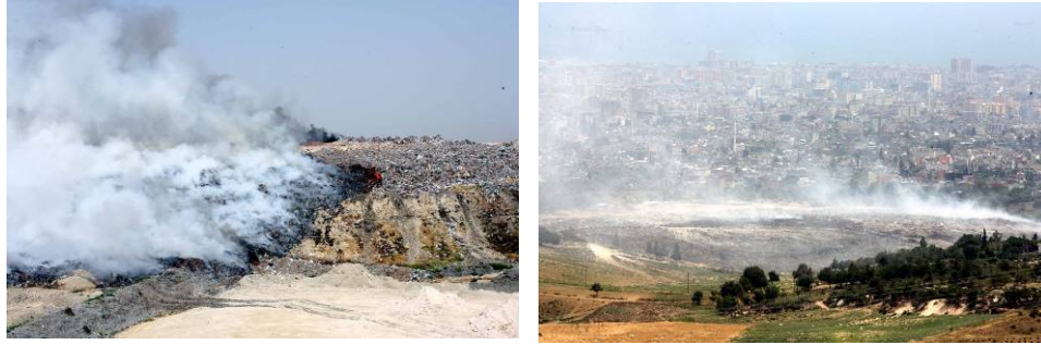
Şekil 1. Rehabilitasyon Öncesi Sahadaki Yangın Görüntüleri

Sahada gaz toplanmasına yönelik herhangi bir tedbir bulunmamaktadır. Açık depolamanın yapıldığı sahada oluşan gaz; çöp kütlesinden ne tamamen uzaklaşabilmekte ne de tamamı kütle içerisinde izole edilebilmektedir. Sahadaki aktif ve pasif yangınlar nedeniyle oluşan yoğun duman, Şekil 1'de görüldüğü gibi dumanlar yerleşim bölgelerine etki etmektedir.